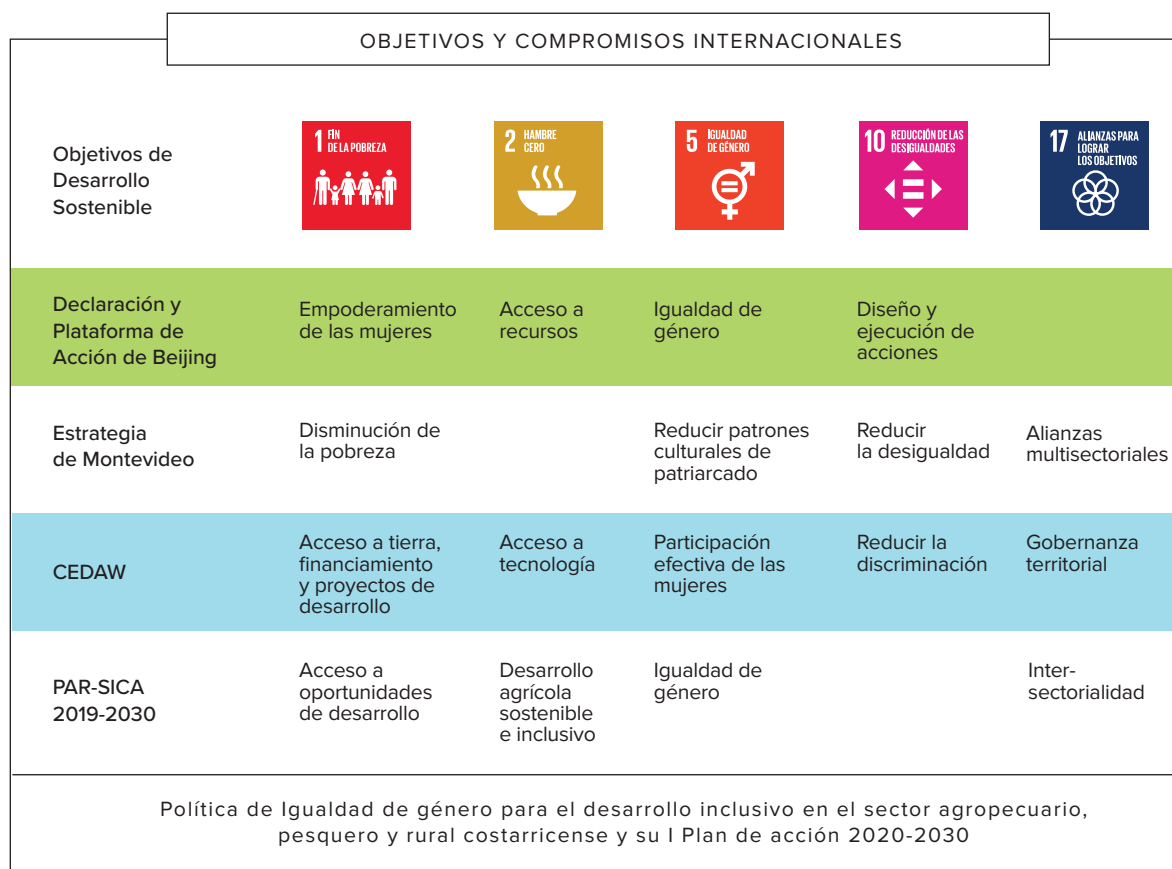
Figura 1 Relación de los compromisos país internacionales con la Política de igualdad de género para el desarrollo inclusivo en el sector agropecuario, pesquero y rural costarricense 2020-2030 y su I Plan de acción.

En el ámbito de los compromisos internacionales asumidos por el Estado, se cuentan con orientaciones y acciones fundamentales para asegurar la eliminación de desigualdades de género que afectan el desarrollo de las mujeres en su contexto agropecuario, pesquero y rural, los cuales se sintetizan a continuación: