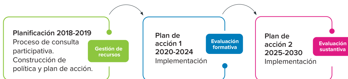
Figura 4 Estructura de seguimiento y evaluación de la Política de igualdad de género para el desarrollo inclusivo en el sector agropecuario, pesquero y rural costarricense 2019-2030 y I Plan de acción

Cabe destacar que este modelo de seguimiento y evaluación requiere de la elaboración anual de informes en los que se reflejen los avances, las limitaciones y los ajustes para el cumplimiento progresivo de las acciones propuestas para cada uno de los ejes estratégicos de la política. La instancia responsable de liderar y articular la elaboración de estos informes anuales y las evaluaciones propuestas es SEPSA, en coordinación con las personas enlace de género de cada una de las instituciones que conforman el sector agropecuario, pesquero y rural, como lo muestra la siguiente figura: