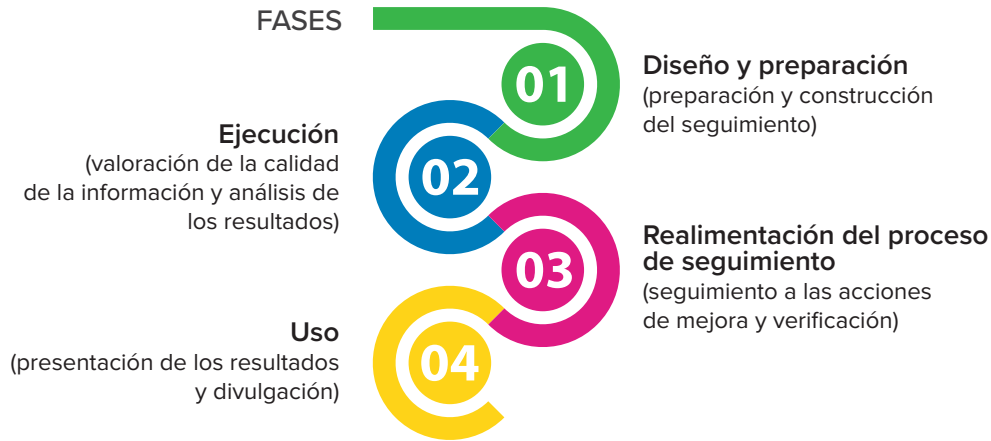
Figura 3 Proceso de seguimiento

Por medio de SEPSA se trabajará en la Fase I: Diseño y preparación, puntualmente en la preparación y construcción del seguimiento, el cual consiste en la revisión de los objetivos, metas, actores y responsables; revisión de indicadores; y establecimiento de las herramientas para el levantamiento de la información y determinación de la viabilidad del seguimiento.