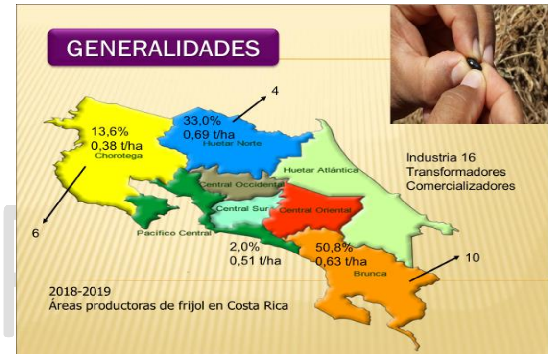
Figura 1. Zonas productoras de frijol en Costa Rica: Ciclo agrícola 2018-2019.

En condiciones habituales, la Región Huetar Norte produce el mayor porcentaje de frijol (cantones de Upala y Los Chiles 50%), seguida de la Región Brunca (Pejibaye de Pérez Zeledón y Buenos Aires 35%) y la Región Chorotega (Santa Cecilia de La Cruz 12%). Sin embargo, esta proporción ha cambiado bastante en los últimos tres ciclos agrícolas, principalmente por eventos climáticos (2017 Huracán Otto y 2018 Tormenta Nate). Dicha situación se resume en el Cuadro 1.