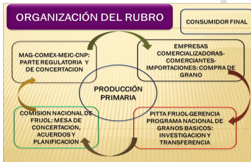
Figura 2. Organización del rubro frijol: niveles de relación.

El sector frijolero está integrado por actores que se mueven en diferentes niveles: se encuentran los productores (producción primaria), los intermediarios, industria compradora e importadora, instituciones públicas, academia y consumidor. El diagrama básico se presenta en la Figura 2.