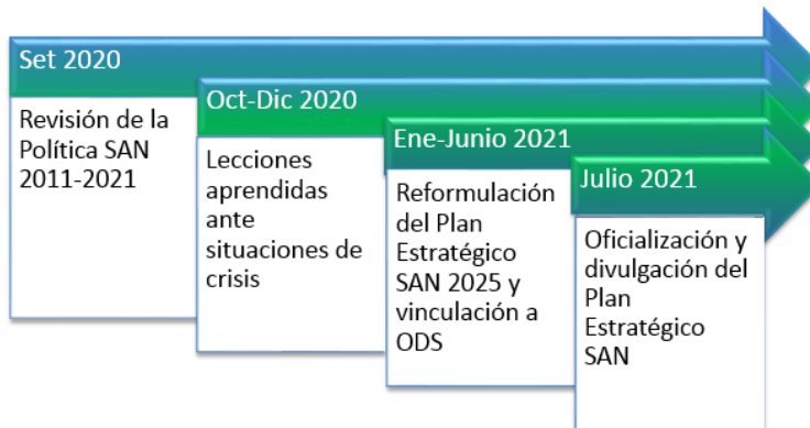
Figura 2. Hoja de ruta para cumplimiento disposición 4.8 de la CGR